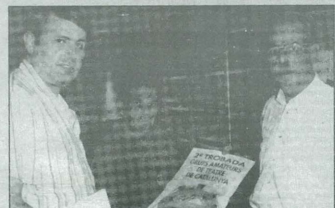
Els organitzadors de la trobada.

trobades més curtes i per als grups federats, la despesa econòmica per als grups és mínima i es concedeixen personalment. Les trobades s'organitzen mitjançant les coordinadores que actuen a nivell comarcal.