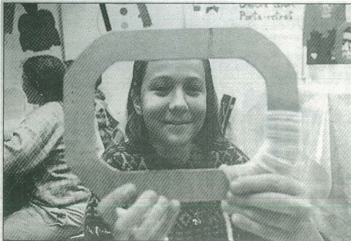
Una nena juga al Parc de Nadal d'Ulldecona.

Com en les altres dues edicions, el CCR ha estat col.laborant amb el Parc Infantil de Nadal. Aquest any hem fet manualitats i dibuix.