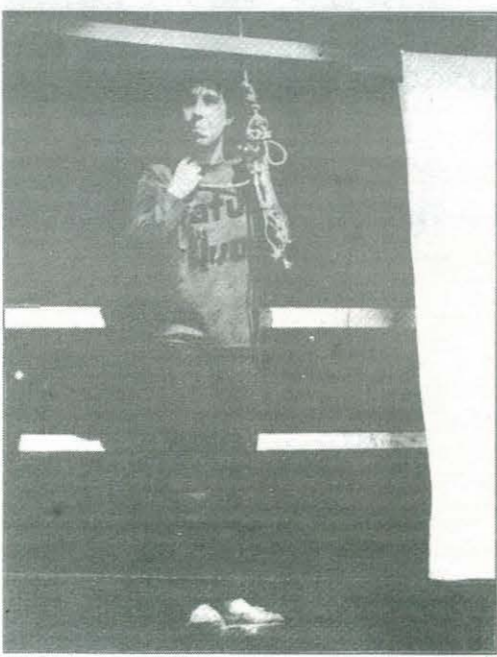
■ A Navàs es vol demostrar que el teatre amateur ja no té la corda al coll